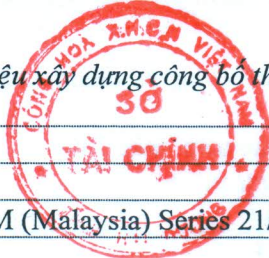
Bảng giá vật liệu xây dựng công bố tháng 12 năm 2015 tại Hải Dương