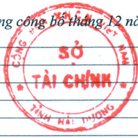
Bảng giá vật liệu xây dựng công bố tháng 12 năm 2015 tại Hải Dương